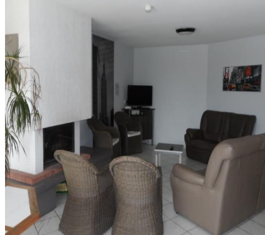
La piscine, une chambre, la cuisine, le hall d'entrée, l'atelier esthétique, un salon d'unité de vie